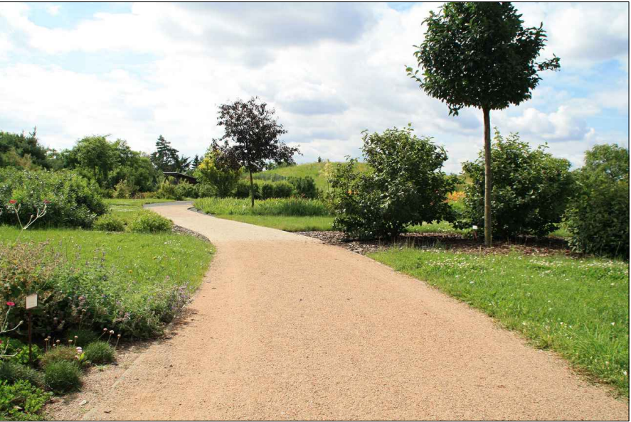
NAVRHOVANÉ MLATOVÉ CHODNÍKY